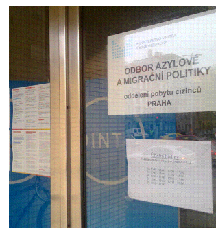
Od 1.1.2011 přebralo OAMP agendu dlouhodobých pobytů

O pozitivních změnách i dosavadních nedostacích ve fungování si můžete přečíst na straně 3.